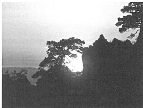
Puesta de sol alrededores residencia

En la actualidad la residencia es consecuencia de la profunda remodelación de la antigua residencia Padre Polanco, de la que se han modernizado instalaciones y servicios. Está libre de barreras arquitectónicas.